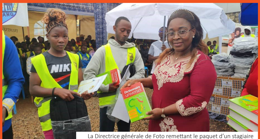
La Directrice générale de Foto remettant le paquet d'un stagiaire

La MUFID Foto s'est alliée à l'initiative de la commune de Dschang pour soutenir et récompenser plus de 320 stagiaires de vacances au cours d'une cérémonie solennelle organisée le 23 août 2024.