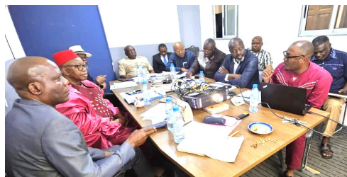
Réunion du Comité de pilotage du projet d'interconnexion du réseau des MUFID

Les MUFID Bandjoun, Demdeng, Bafoussam, Baleng, Baham, Mbalmayo, Bamougoum, Bangangté et les deux agences MUFID Union (Yaoundé et Douala) fonctionnent désormais uniquement avec CloudBank